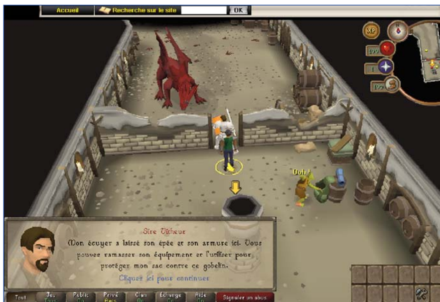
Figure 2 : « Le jeu RuneScape, initiation du joueur. »

Ici encore, les élèves en salle de classe s'inscrivent sur le site (5 min), puis explorent l'environnement de leurs personnages (5 min). Ils suivent ensuite individuellement le parcours d'initiation (40 min) en lisant les indications des différents personnages pour réaliser des actions à l'intérieur du jeu, comme, par exemple, protéger le sac contre l'intrusion du gobelin (voir figure 2). La compréhension est validée par le progrès réalisé par le personnage. L'enseignante ou l'enseignant pourra définir le vocabulaire nouveau au fur et à mesure, ou encore les élèves pourront constituer ensemble une banque de mots à partir de ce parcours. Dans un deuxième temps, en dehors du jeu, l'élève pourra rédiger un texte qu'il remettra à l'enseignante ou l'enseignant en utilisant le vocabulaire de la banque de mots, validant ainsi son apprentissage.